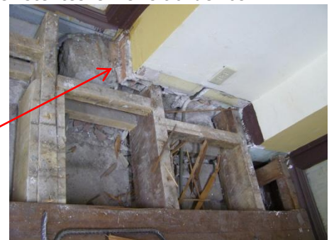
Apoyo de la losa que no supera los 33

Si en una primera instancia se consideró como opciones de sujeción tanto la losa como el envigado, resulta irresponsable seguir haciéndolo por lo que, lo prudente y necesario en las actuales circunstancias es independizar los sistemas estructurales de piso y de vitral;