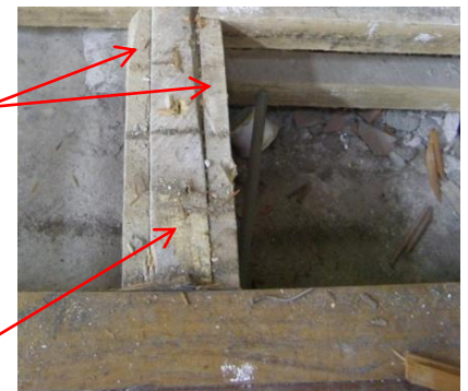
Presencia de TERMITAS